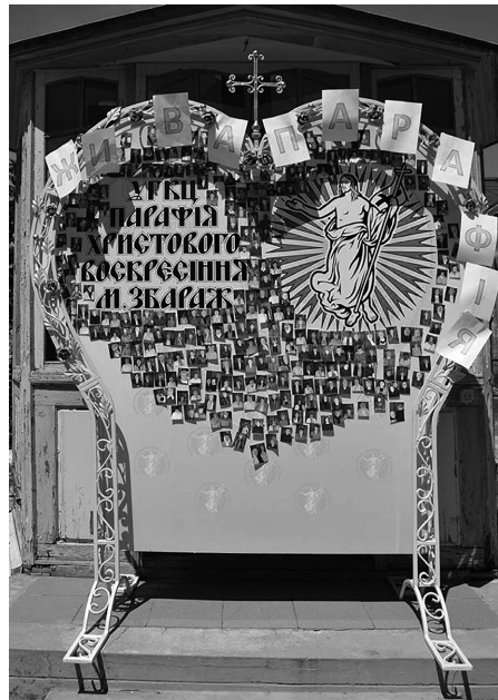
Арки, які уже були виготовлені на парафіях

Господи Ісусе Христе, Пастирю Добрий, як колись Ти пригорнув заблуканих овечок, щоб вони пізнали Твій голос і були Твоїм стадом, так і сьогодні глянь ласкаво з небесних висот на нашу парафію та зішли на неї Твого Святого Духа, щоб вона була місцем пізнання радості Доброї Новини. Скріплюй нас Твоєю присутністю та єднай нас кожночасно в молитві. Даруй нам духа служіння ближньому, щоб у нашій парафії кожний міг зустріти Тебе, милостивого Бога. Благослови наш духовний провід Твоєю мудрістю і дай, щоб ніхто з нас не шкодував ні часу, ні талантів, ні матеріальних дібр для розбудови Твого Царства. Єднай нас у мирі та злагоді, щоб ми були Твоєю спільнотою любові. Всели в нас місійного духа, щоб ми стали тим світилом євангельського слова, молитви і добрих діл, що кличе кожного до участі в Божественному житті, щоб славилася, Спасе, Твоє ім'я з безначальним Твоїм Отцем та пресвятим, благим і животворящим Твоїм Духом нині, і повсякчас, і на віки віків. Амінь.